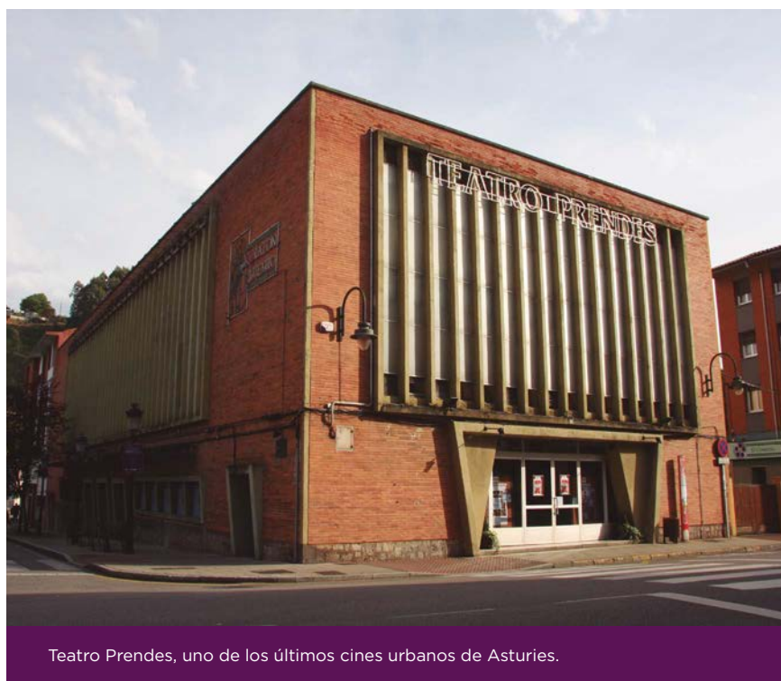
Teatro Prendes, uno de los últimos cines urbanos de Asturias.

SOMOS Carreño sigue considerando prioritario que tanto la gestión como la propiedad del Teatro Prendes sea pública. No se trata de “quitar” un bien a nadie, tal como se intentó argumentar desde los grupos municipales que se opusieron a la compra. Lo que pasa es que no se pueden pagar dos millones y medio de euros simplemente porque lo pida la propiedad. La expropiación es el procedimiento legal que tiene una administración pública para poder comprar a un precio de mercado real y justo para todas las partes. De eso se trata.